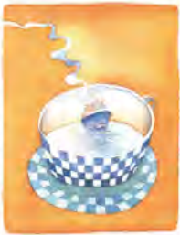
JACQUES PREVERT LE DÉJUNER DU MATIN - © FOLON