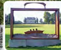
De Stichting Folon - Solvay-domain in La Hulpe