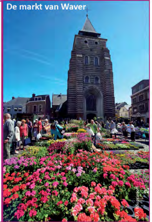
De markt van Waver

Waterloo is wereldwijd bekend voor zijn historisch slagveld, maar ook zijn 'tarte au sucre' geniet van een goede reputatie. Zij bestaat uit brooddeeg bedekt met suiker of kandisuiker waar men boter, eieren en melk heeft toegevoegd en ze wordt verkocht bij de lokale bakkers. Op enkele kilometers van de Heuvel met de Leeuw ligt Genappe, bekend voor zijn 'tarte du Lothier' op basis van griesmeel, abrikozen en amandelen. ( www.waterloo-tourisme.be )