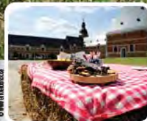
Smaken van de streek