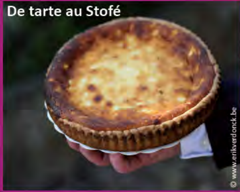
De tarte au Stofé

In het westen van Waals-Brabant, in Rebecq, vertelt men het verhaal over het harmonieuze samenzijn van water, granen en bier. De Kleine Molen van Arenberg , aan de oever van de Zenne, heeft nog steeds zijn maalderij en het Maison de la Bière , het Bierhuis, onthult u enkele fabricatiegeheimen van de Brouwerij Lefèbvre. In de taverne van de Grote Molen kunt u enkele lokale bieren proeven, zoals de zachte 'Barbar' , een blond bier met honingsmaak dat gebrouwen wordt op de oude manier. ( www.tourisme-roman-pais.be )