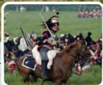
De herdenking van de Slag bij Waterloo