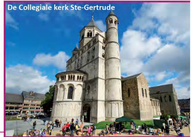
De Collegiale kerk Ste-Gertrude

In het westen van Waals-Brabant, in Rebecq, vertelt men het verhaal over het harmonieuze samenzijn van water, granen en bier. De Kleine Molen van Arenberg , aan de oever van de Zenne, heeft nog steeds zijn maalderij en het Maison de la Bière , het Bierhuis, onthult u enkele fabricatiegeheimen van de Brouwerij Lefèbvre. In de taverne van de Grote Molen kunt u enkele lokale bieren proeven, zoals de zachte 'Barbar' , een blond bier met honingsmaak dat gebrouwen wordt op de oude manier. ( www.tourisme-roman-pais.be )