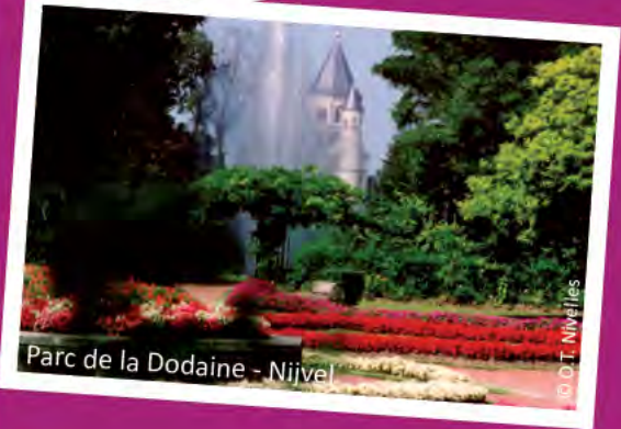
Parc de la Dodaine - Nijvel