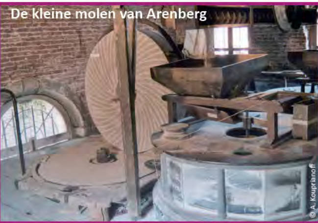
De kleine molen van Arenberg