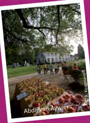
Abdij van Aywiers