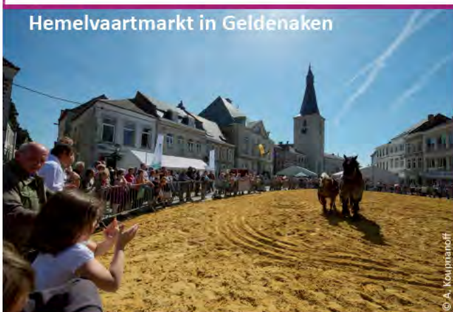
Hemelvaartmarkt in Geldenaken

In Nijvel kunt u flaneren in de Saint-Jacqueswijk , de oude brouwerswijk die nog veel sporen vertoont van de vroegere activiteiten. Op de vernieuwde Grand-Place lijken de vele 'Estaminets' in bewondering te staan voor de collegiale kerk Ste-Gertrude. Neem de tijd om er te proeven van de beroemde 'tarte al djote' , een hartige taart op basis van zachte kaas en snijbiet. Drink er een 'Jean de Nivelles' bij, een blond bier van hoge gisting. ( www.tourisme-nivelles.be )