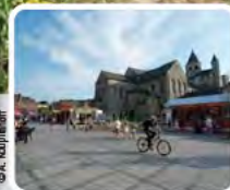
De Collegiale kerk Ste-Gertrude in Nivelles