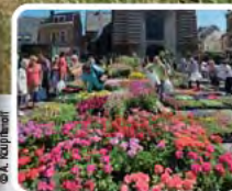
De markt van Wavre