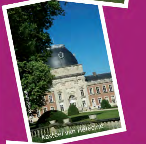
Kasteel van Hélécine