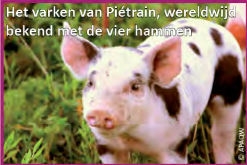
Het varken van Piétrain, wereldwijd bekend met de vier hammen