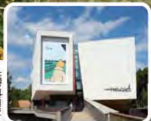
Het Hergé Museum in Louvain-la-Neuve