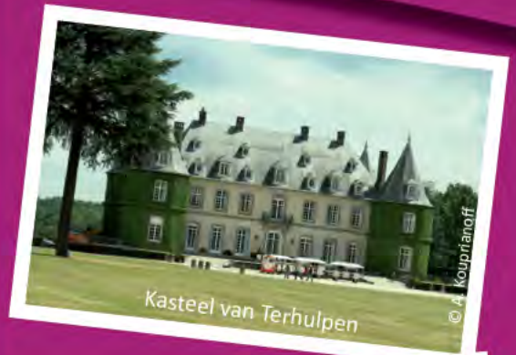
Kasteel van Terhulpen

Bent u eerder een stadsverkenner, dan nodigt Nijvel u uit voor een centrumwandeling. De majestueuze Collegiale kerk Sainte- Gertrude , een architecturale maar ook archeologische parel, verrijst op de volledig vernieuwde Grand-Place. Het stadsplein is afgezoomd met sympathieke cafés en restaurants. De aanpalende straten (brouwerswijk) ogen charmant en de hartelijkheid van de 'Nivellois' zorgt voor een gezellige sfeer. Neem ook een kijkje in het geklasseerde Parc de la Dodaine met zijn mooie Franse en Engelse tuinen. Hebt u een bijkomende reden nodig om naar Nijvel te gaan, kom dan de stad ontdekken ter gelegenheid van de 'Tour Sainte-Gertrude' op 2 oktober. Deze ommegang is hét grote folkloristische en toeristische evenement van de herfst. ( www.tourisme-roman-pais.be of www.tourisme-nivelles.be )